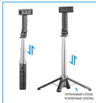
ТИТАНОВЫЙ СПЛАВ УСИЛЕННЫЕ ОПОРЫ

Когда монопод переключается в режим штатива, обратите внимание на то, что нужно вытянуть последнюю секцию рукоятки и отрегулировать её до тех пор, пока штатив не станет устойчивым.